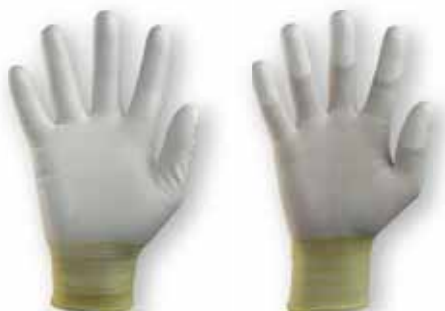
HYFLEX® Lite 11-600