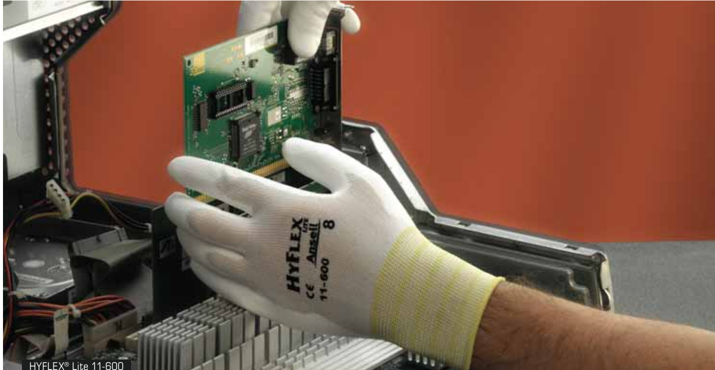
HYFLEX® Lite 11-600