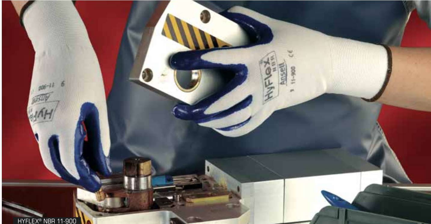
HYFLEX® NBR 11-900