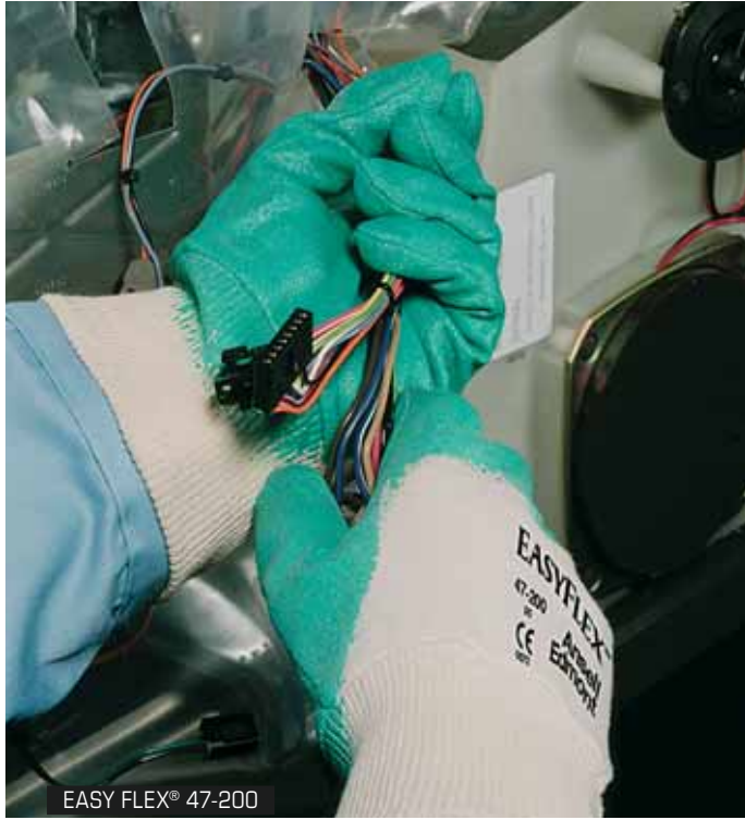
EASY FLEX® 47-200