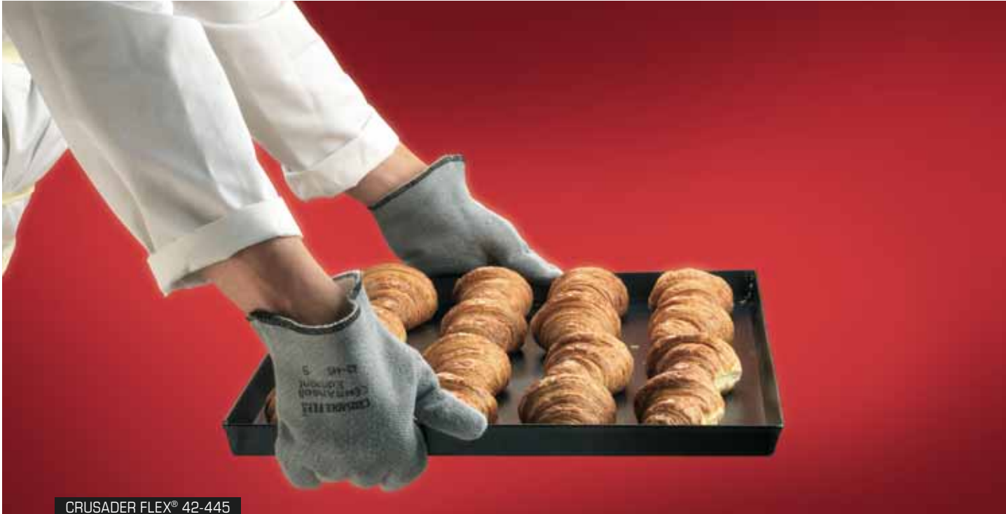
CRUSADER FLEX® 42-445